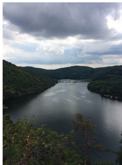
Výhledy z malého puťáku 2018